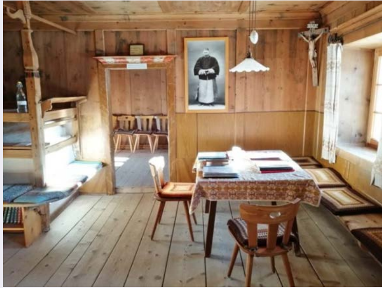
Il lavoro missionario.jpg