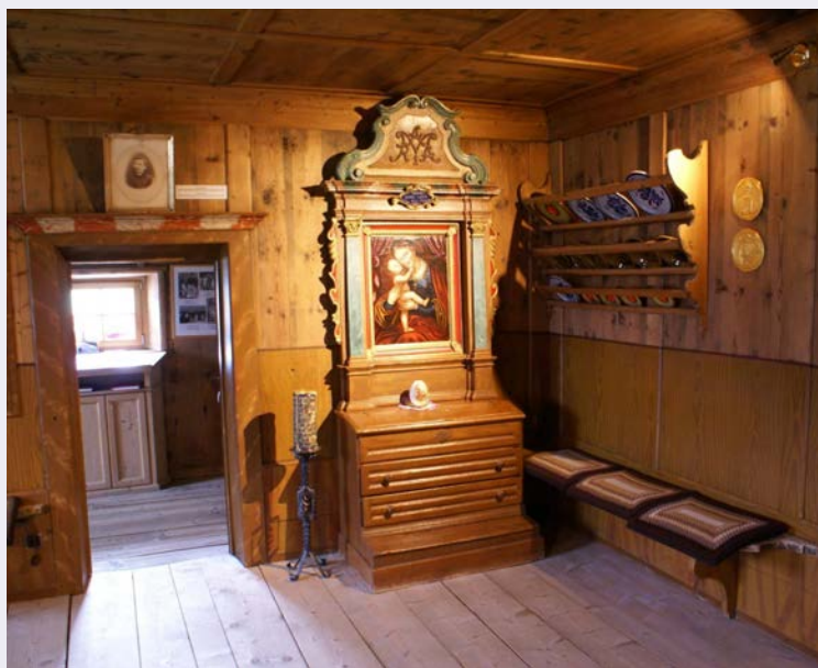
Casa natale particolare.jpg