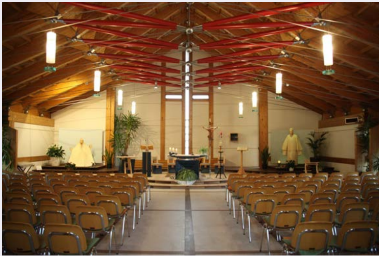
Interno luogo sacro.jpg