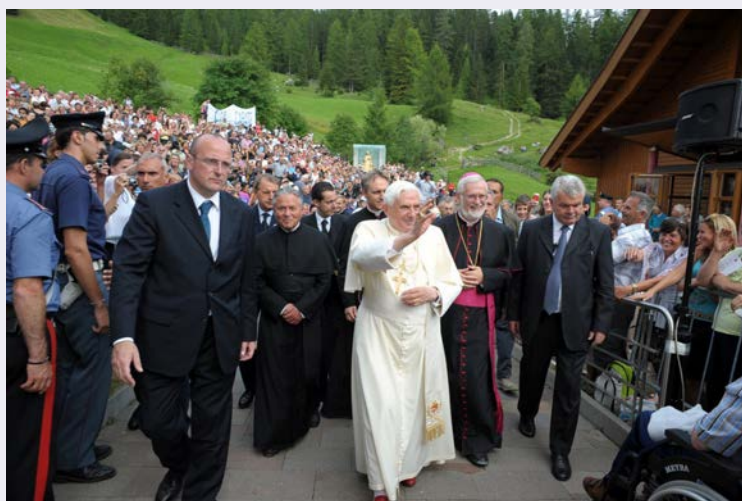
Papa Benedetto con i fedeli.jpg