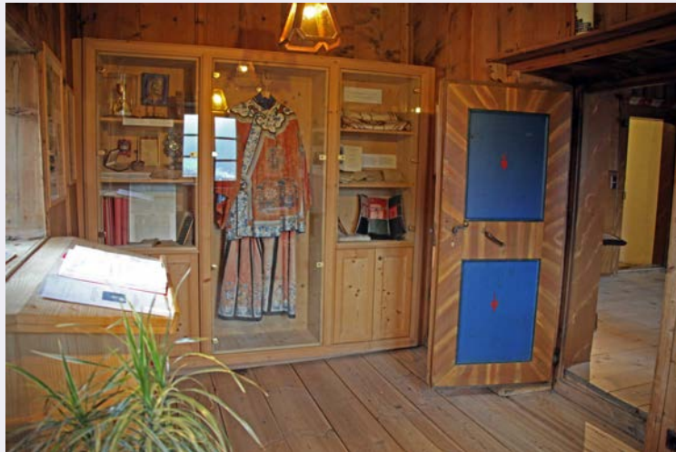
Casa natale crocifisso.jpg