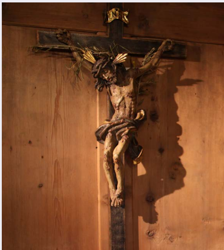
Visita al Santuario di Papa Benedetto.jpg