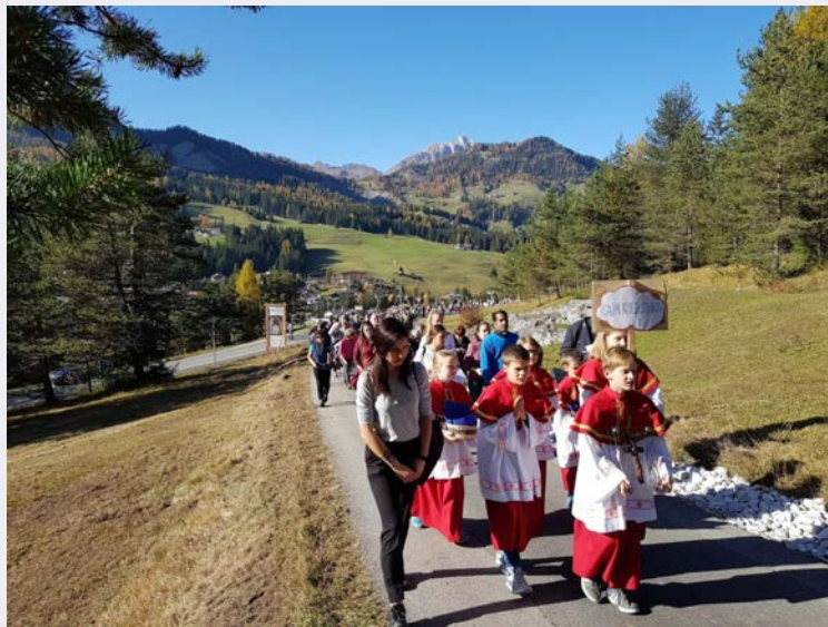
Particolare corteo fedeli.jpg