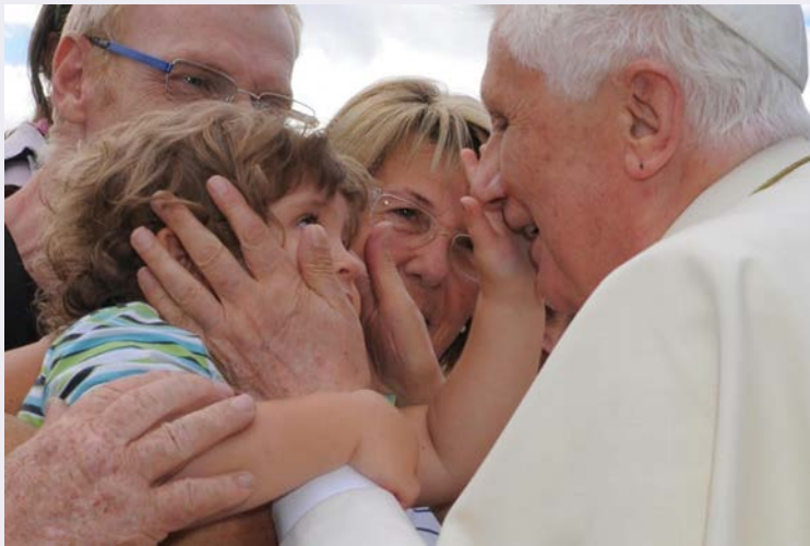
Papa Benedetto in visita al Santuario.jpg