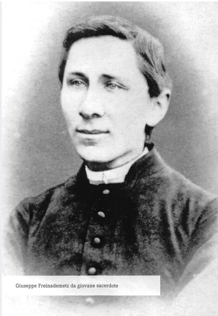
Giuseppe Freinademetz da giovane sacerdote