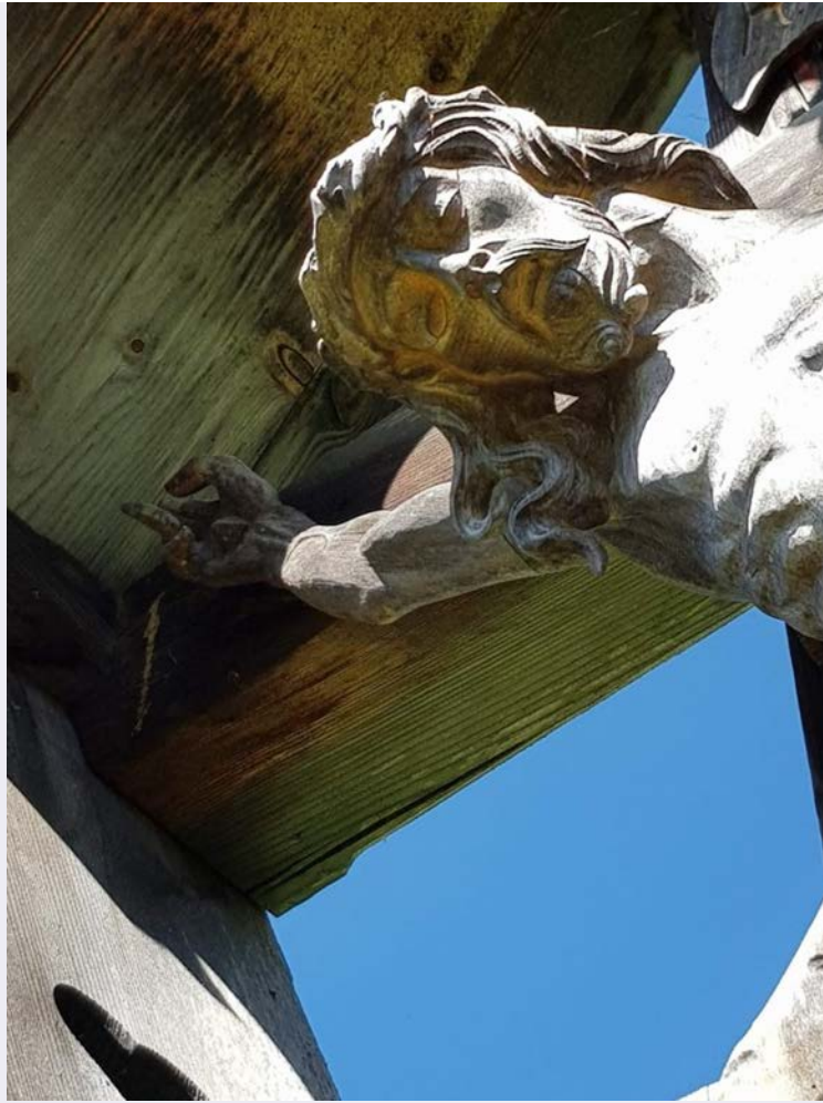
I genitori del giovane Giuseppe.jpg