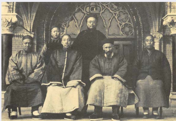
Particolare missione in Cina.jpg