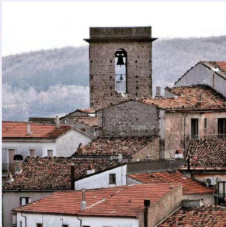
Particolare campanile santuario centro storico.jpg