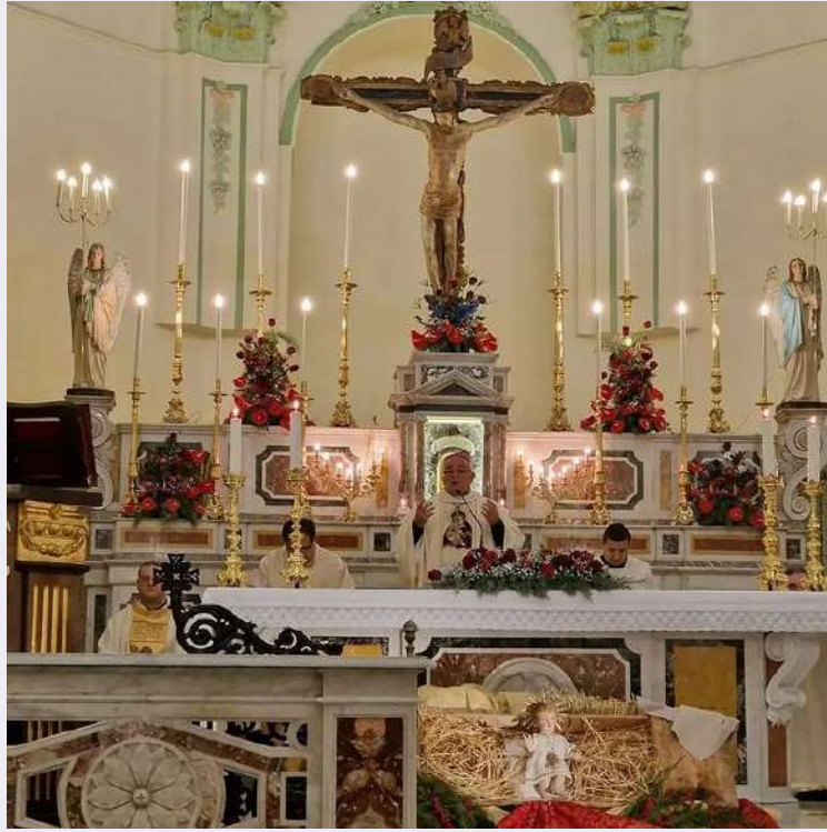
Reliquia del Sacro Sangue di Santa Sinfiorosa.jpg