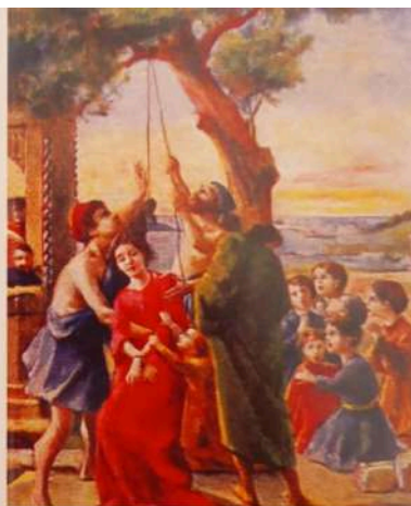
Martirio di Santa Sinfiorosa Vedova e Martire Protettrice di S. Chirico Raparo (Potenza) Festività 18 luglio