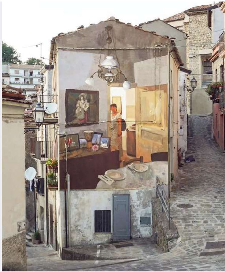
Centro storico e particolare campanile santuario.jpg