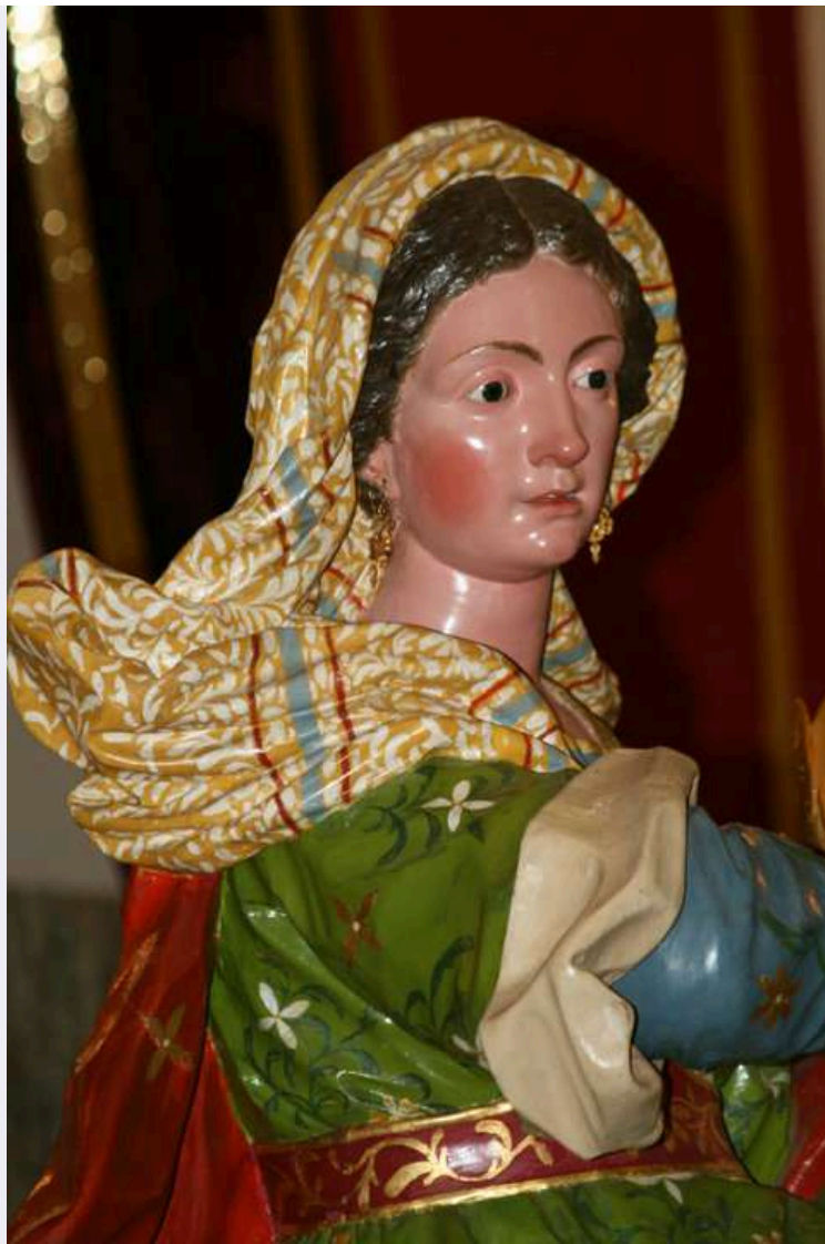
Traslazione statua sacra effigie.jpg