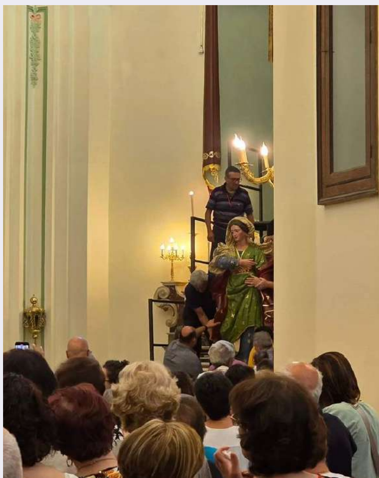
Benedizione sacra effigie.jpg