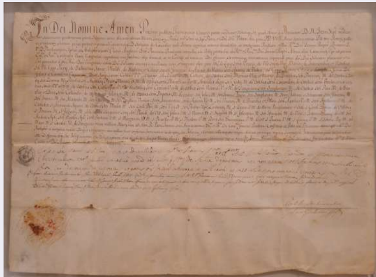
Decreto Santuario Diocesano.jpg