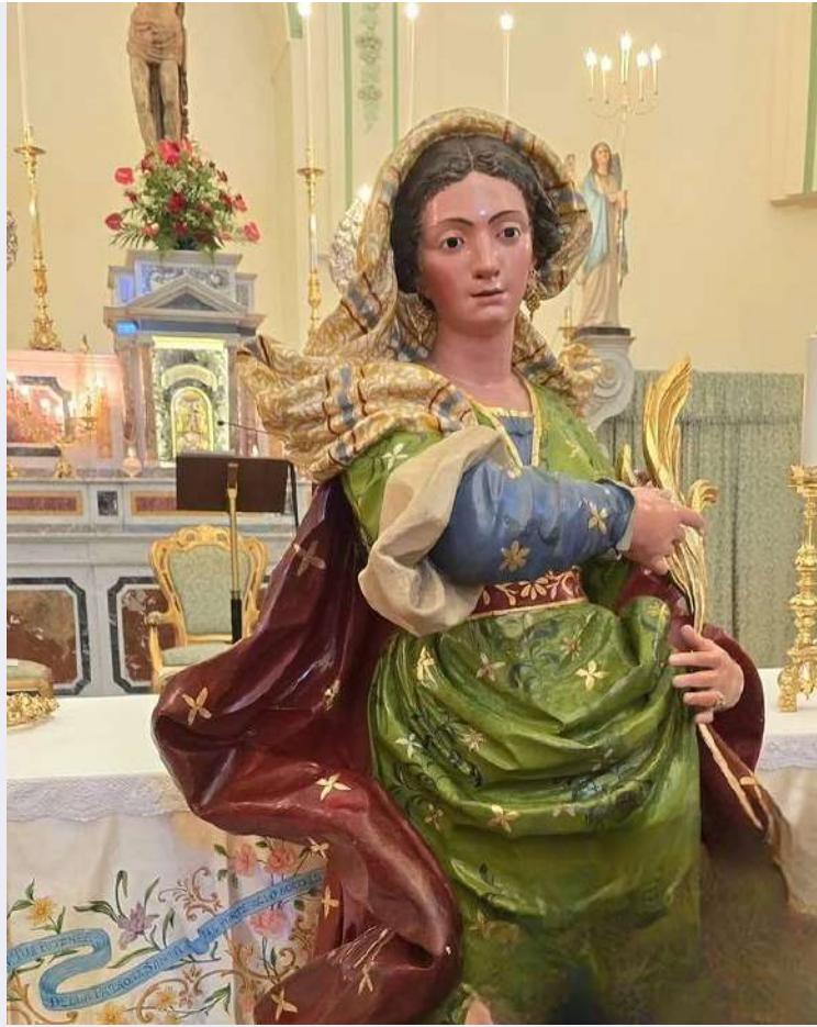
Particolare volto sacra effigie.jpg