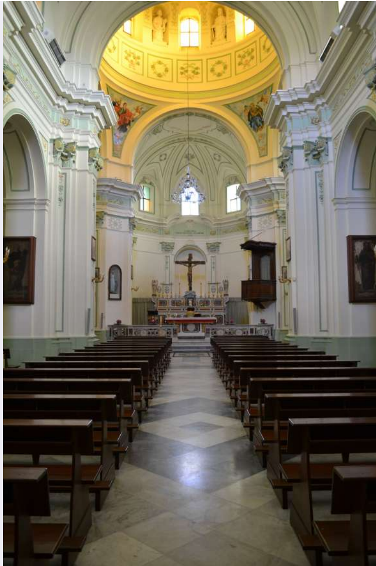
Interno luogo sacro con devoti.jpg