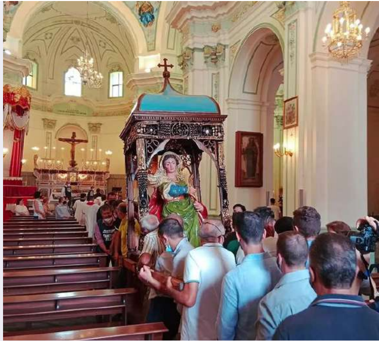
Processione con la sacra effigie.jpg