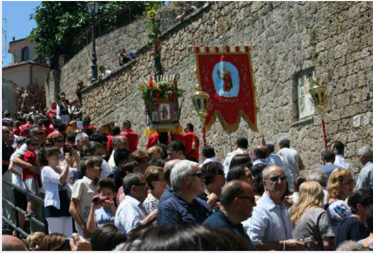
Corteo con statua sacra effigie.jpg