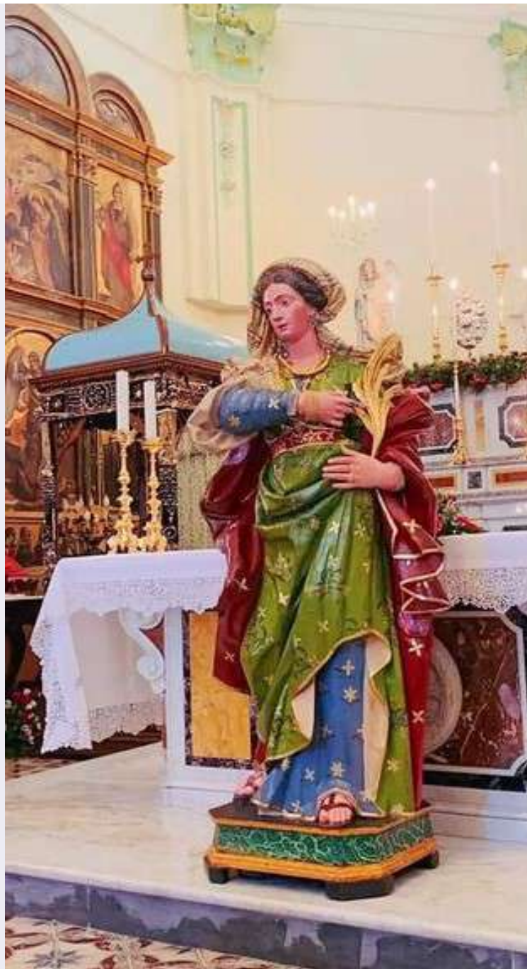
Particolare sacra effigie.jpg