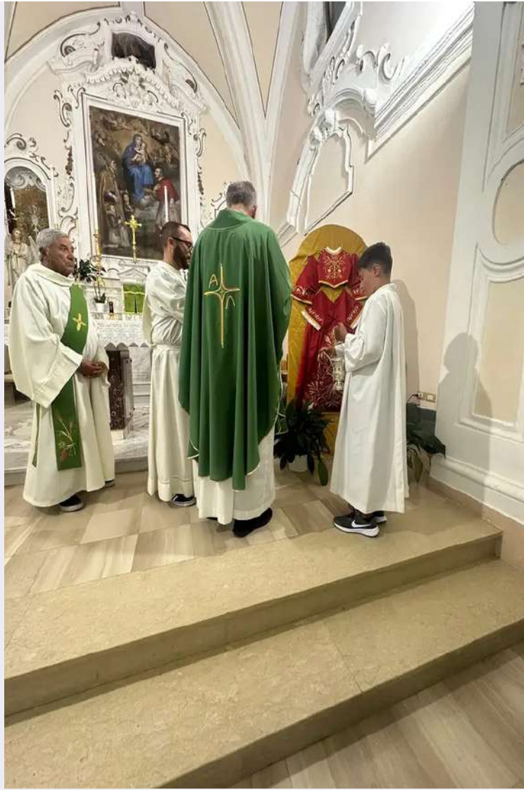
Abito Statua Madonna.jpg