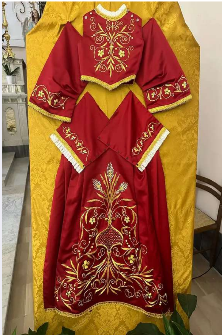
Madonna del Lauro.jpg