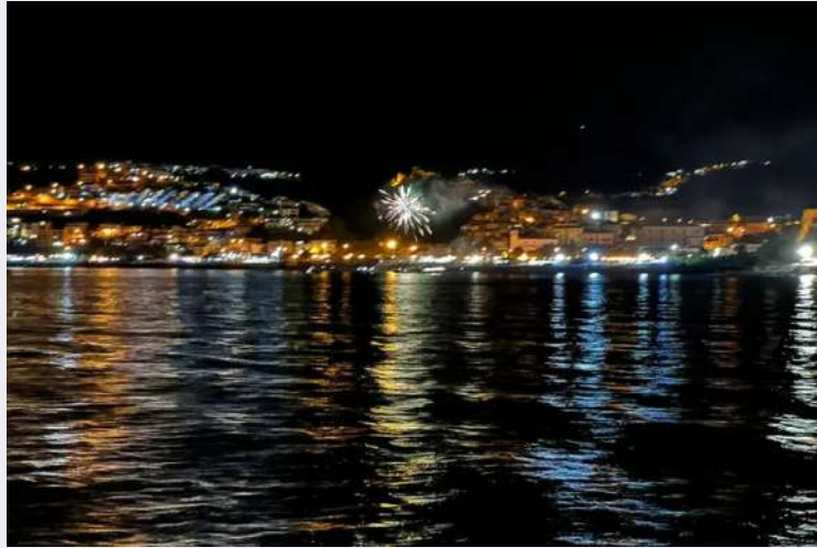
Decreto Santa Maria del Lauro.pdf