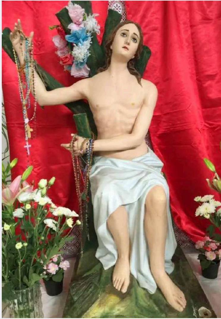
San Pantaleone particolare.jpg