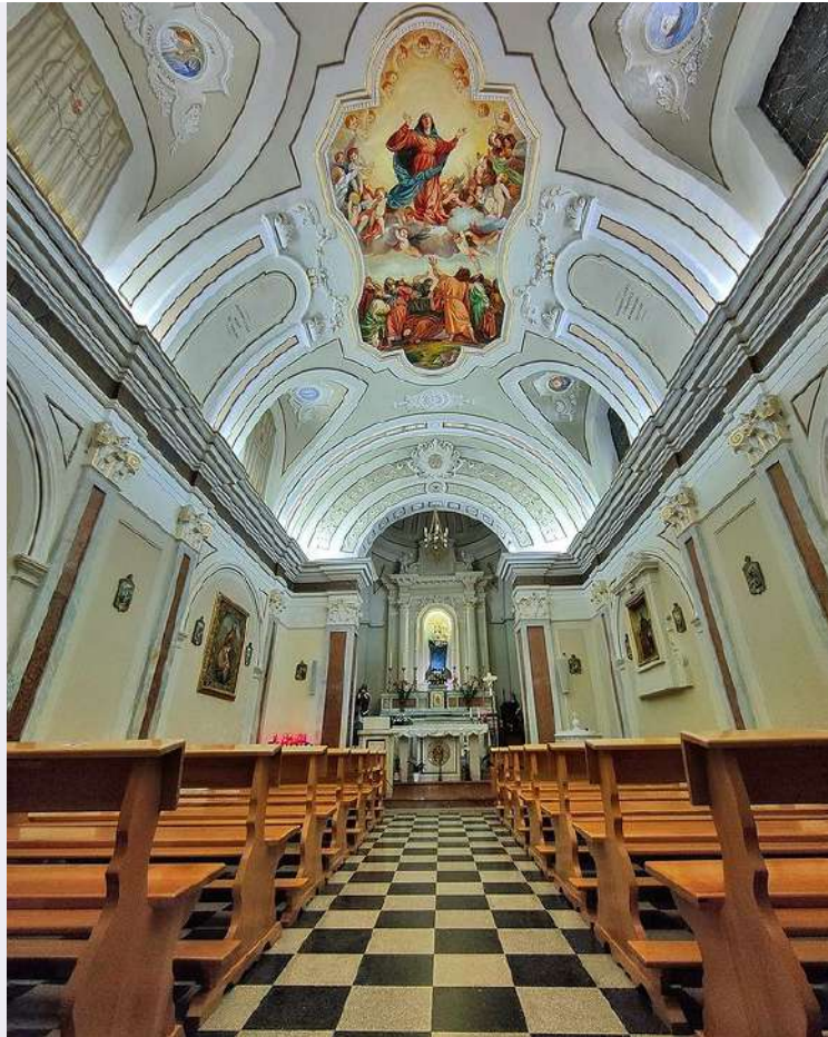
Vista interno ingresso.jpg