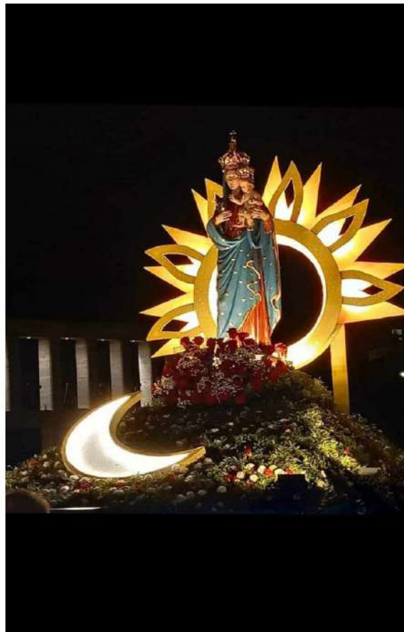
Particolare sacra effigie.jpg