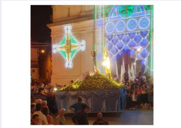
Maria Santissima di Termini.jpg