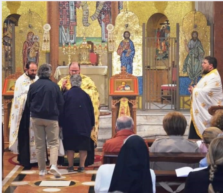
Fedeli vestiti con abiti tradizionali.jpg