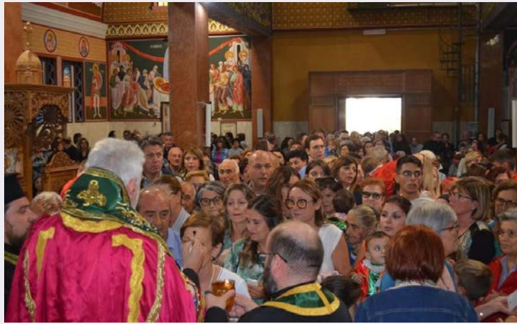
Celebrazione Inno Akathistos ai Santi Medici.jpg