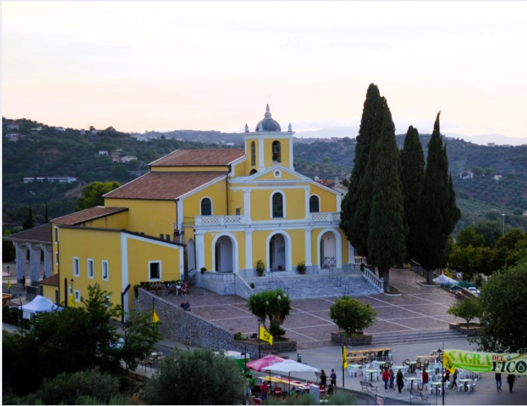
Particolare facciata santuario.jpg