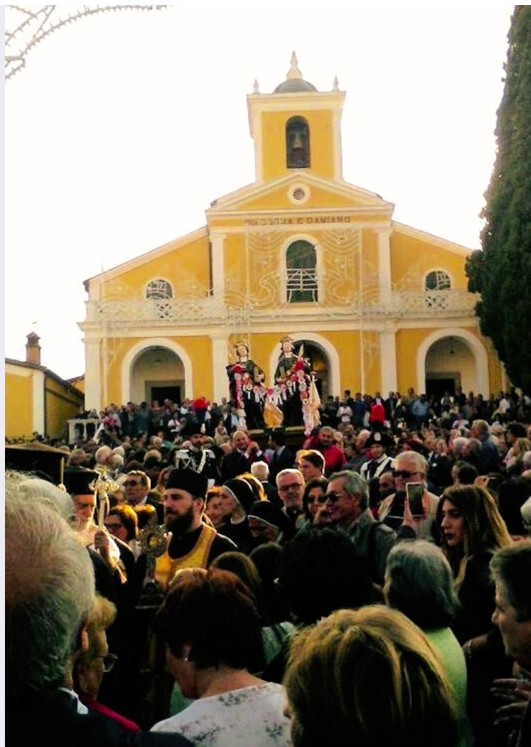
Processione con la statua dei Santi Cosma e Damiano davanti al santuario.jpg