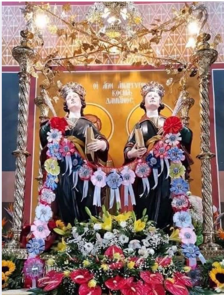
I Santi Cosma e Damiano.jpg