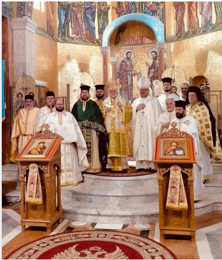
Celebrazione presieduta dal Vescovo Donato Oliverio.jpg