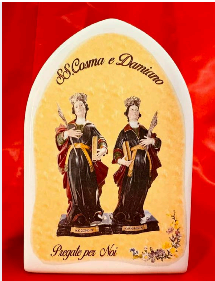
Santino dei Santissimi Cosma e Damiano con preghiera.jpg