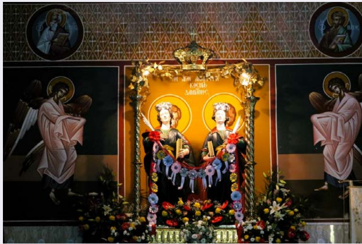
Altare Santi Medici con i devoti.jpg