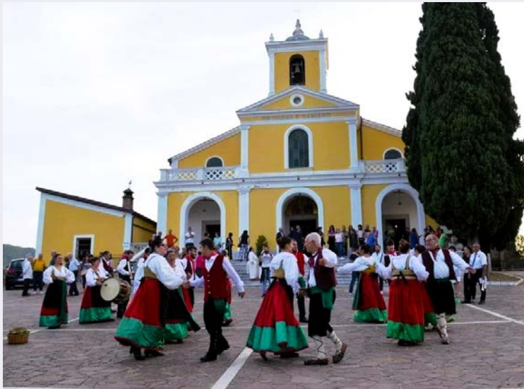
Decreto di erezione a Santuario Diocesano dei Santissimi Cosma e Damiano.jpg