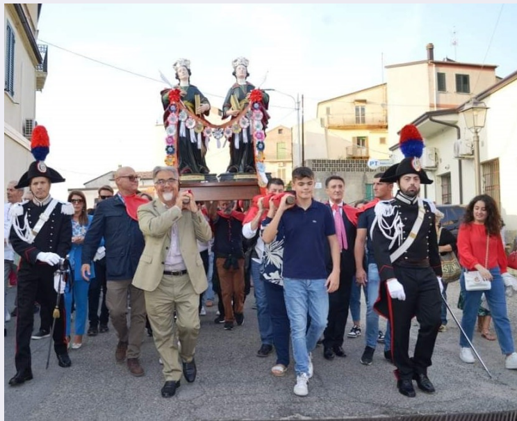
Devoti e pellegrini dinanzi al luogo sacro con il simulacro dei Santi Medici.jpg