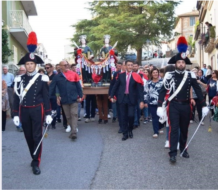
In cammino con i Santi Cosma e Damiano.jpg