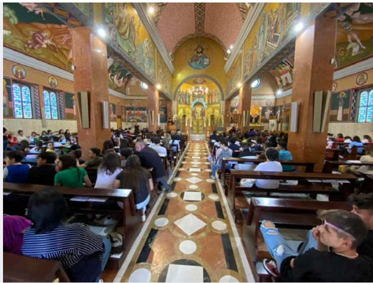
Particolare interno luogo sacro.jpg