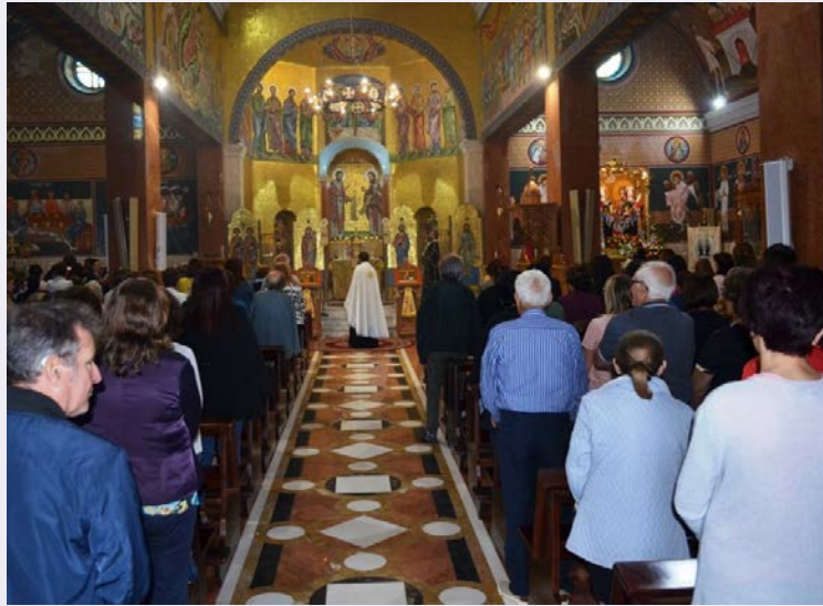
Simulacro Santi Cosma e Damiano.jpg