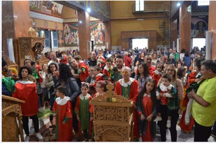
Novena in preparazione alla festa dei Santi Medici Cosma e Damiano.jpg