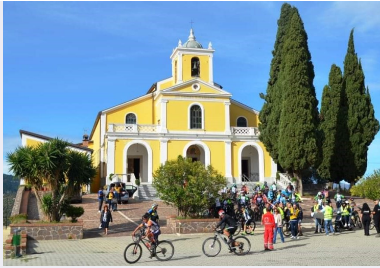
Santuario illuminato notturno.jpg