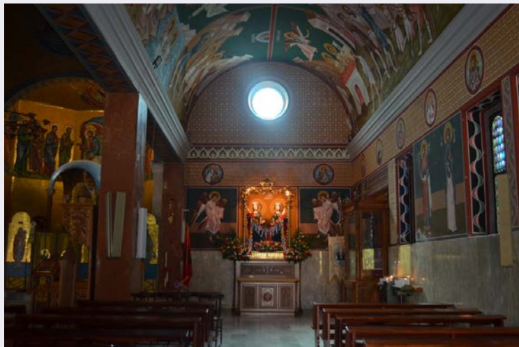
Altare Santi Cosma e Damiano.jpg