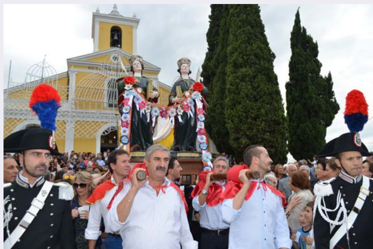
Processione con il simulacro dei Santi Medici.jpg