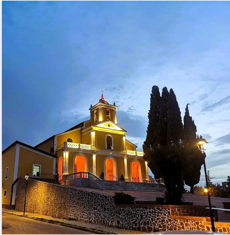
Spazio esterno luogo sacro.jpg