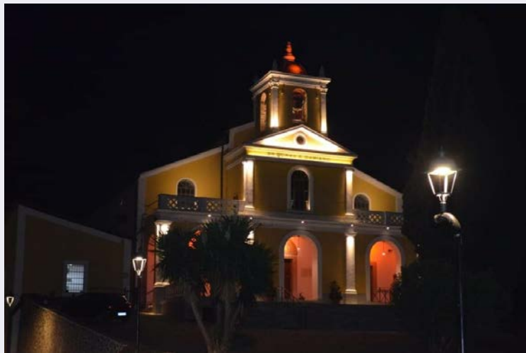
Esterno Santuario Santi Medici.jpg