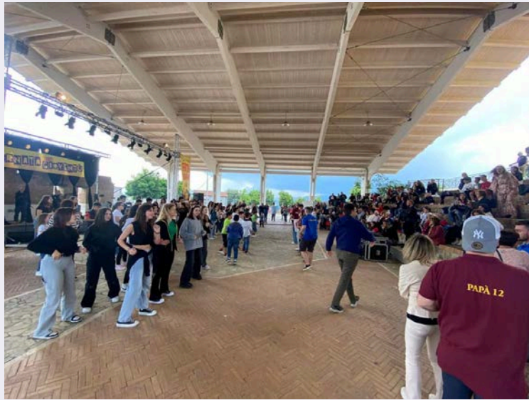
Interno Santuario con devoti.jpg