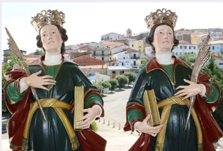
Celebrazione in onore dei Santi Medici.jpg