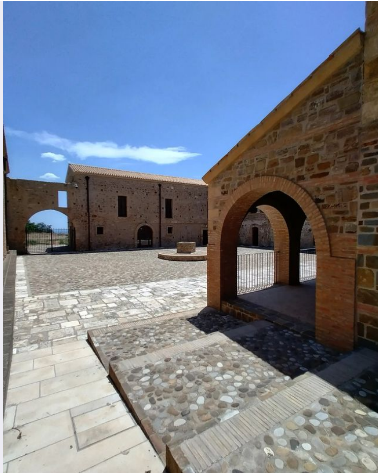
Esterno Santuario Abbazia.jpg