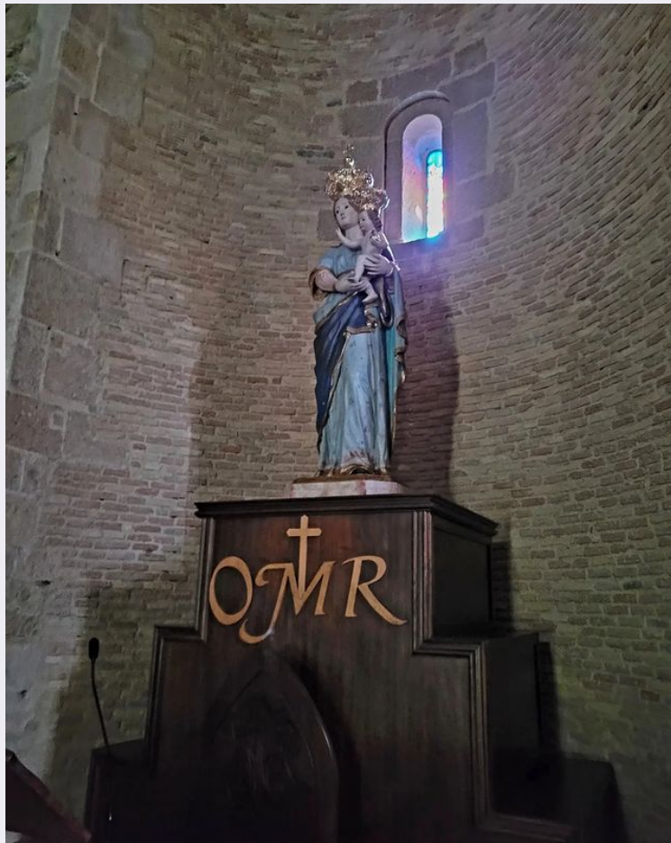
Sacra effigie Pisticci.jpg