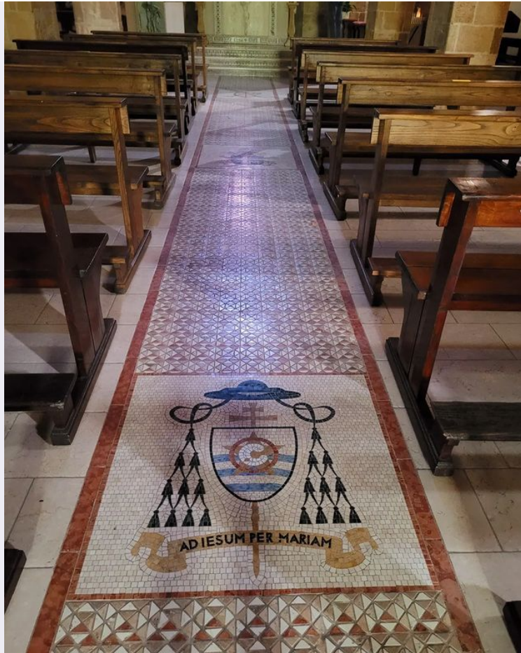
Interno Santuario Pisticci.jpg