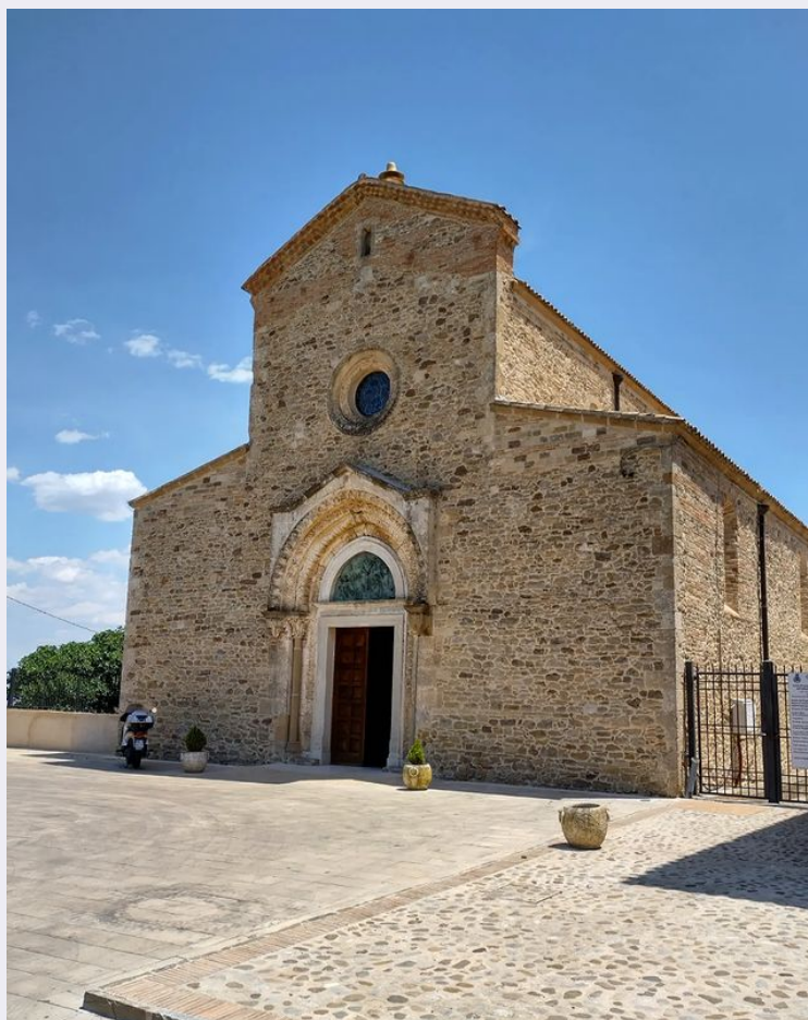
Spazi esterni luogo sacro.jpg