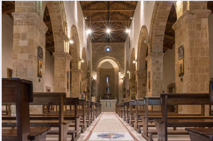
Interno luogo sacro.jpg