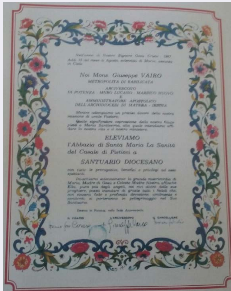
Immaginetta storica con preghiera.jpg