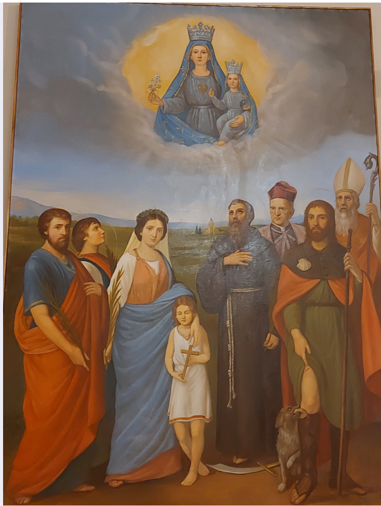
Dipinto miracolo di San Rocco a Grisolia.jpg