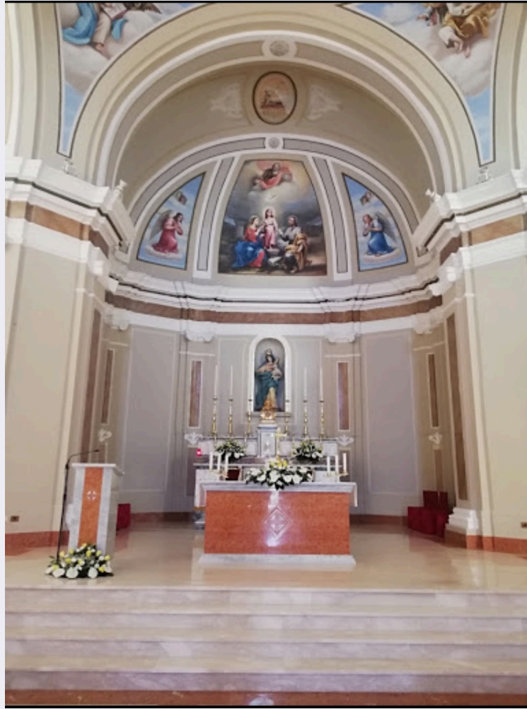
Statua di San Rocco con reliquie.JPG