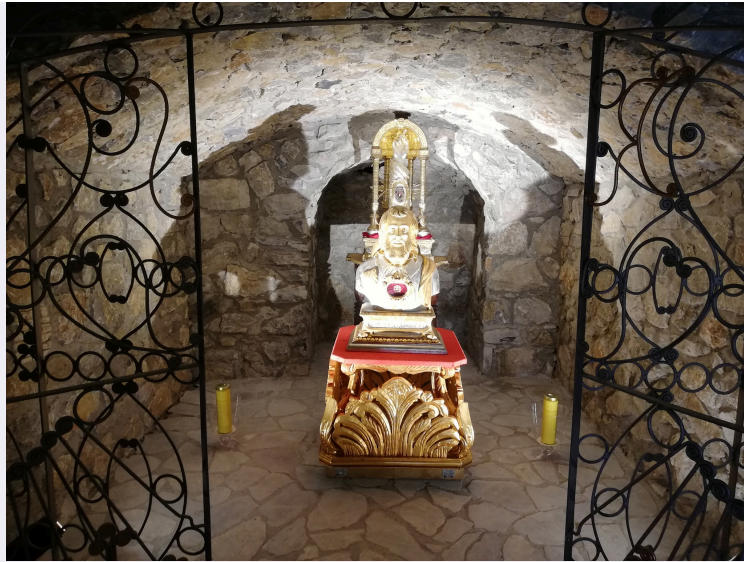
Busto con reliquie di San Rocco.jpg