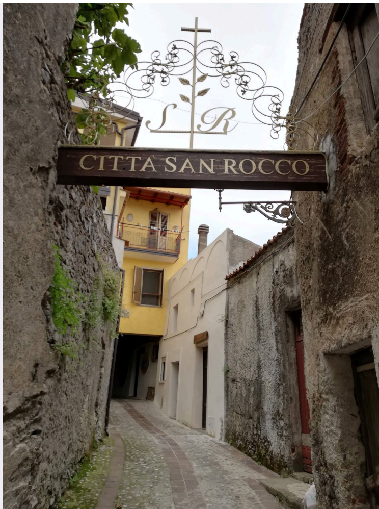
Processione San Rocco.jpg