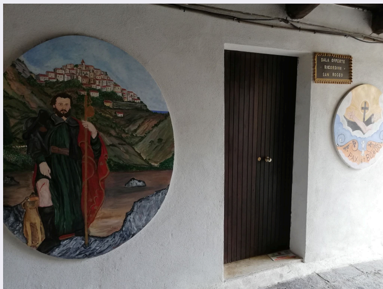
Ingresso sala ricordini.jpg