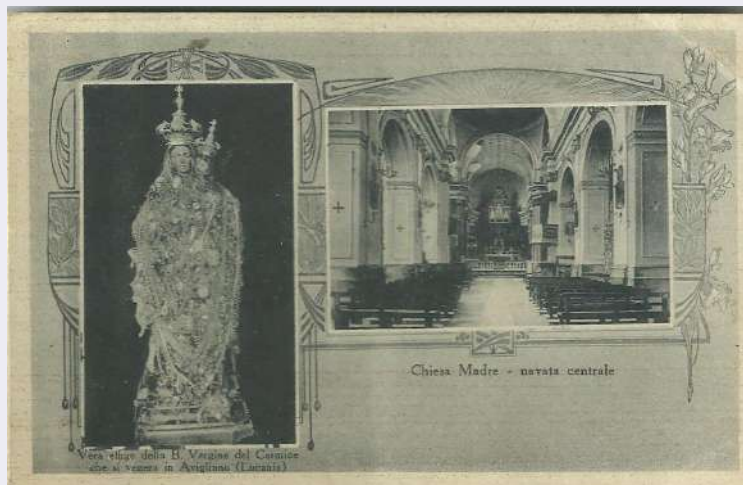
Elevazione Basilica Minore.jpg