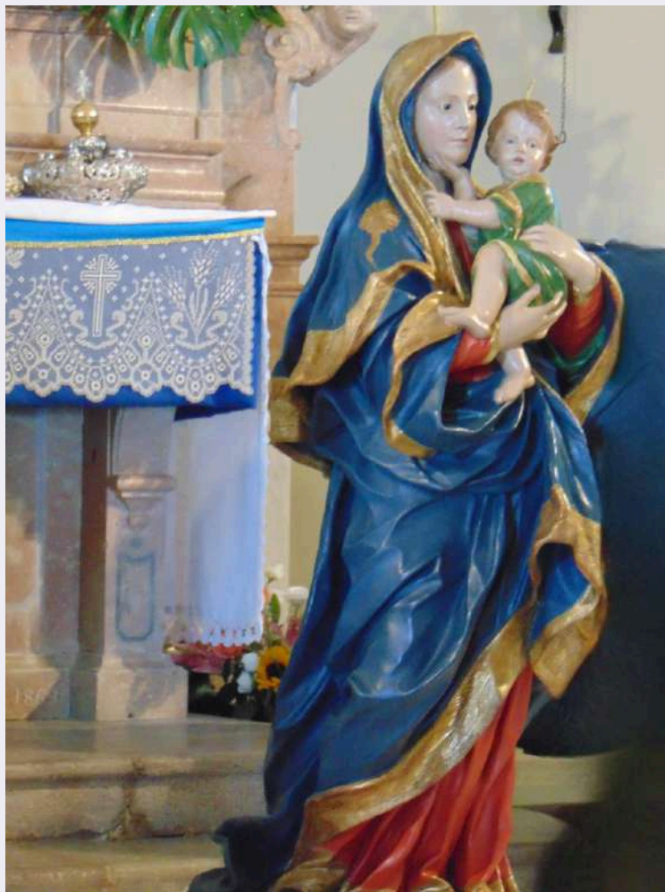
Vestizione Vergine del Carmine.jpg