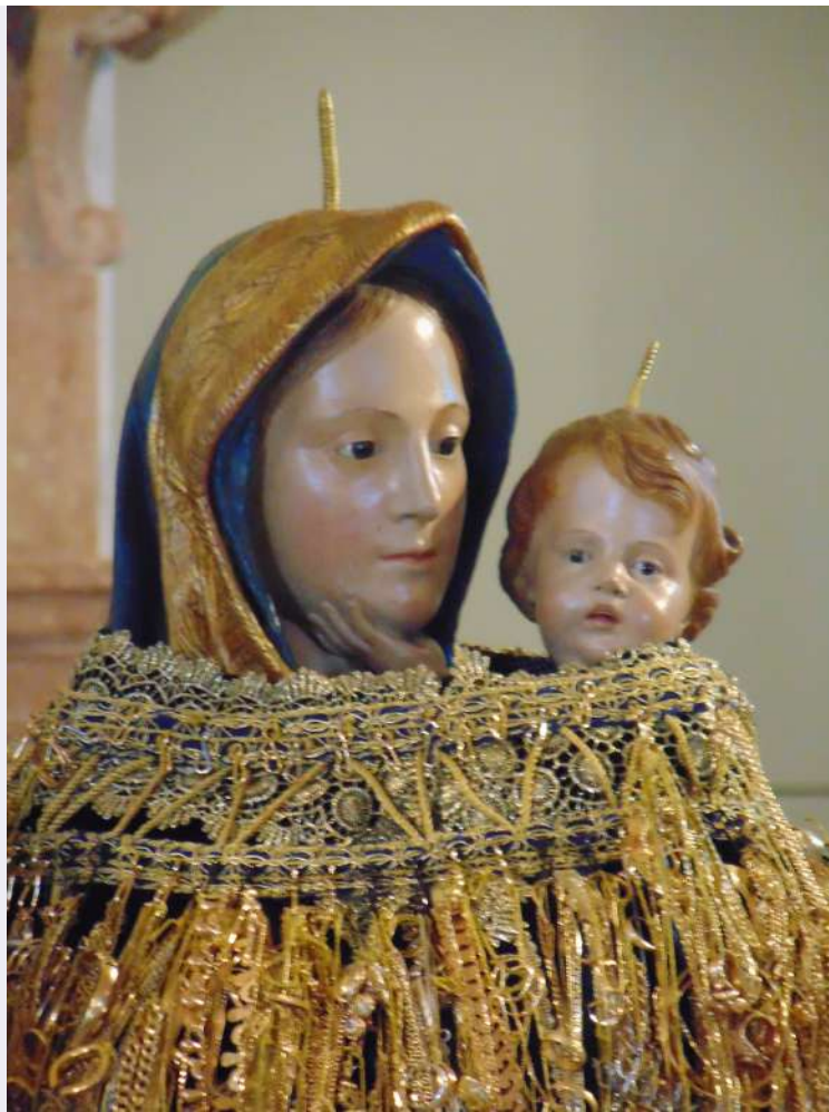
Madonna del Carmine.jpg