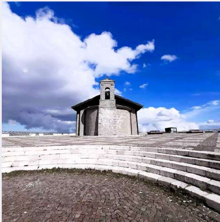
Luogo di culto.jpg