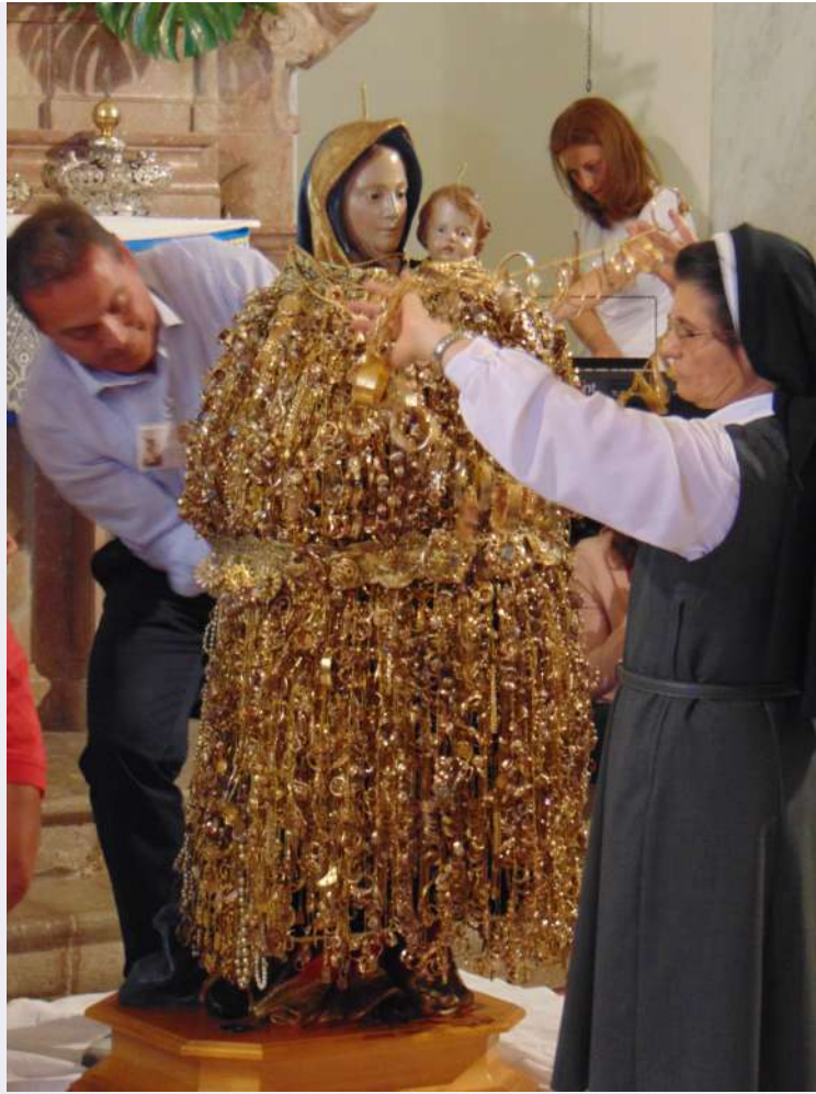
Particolare statua con gli ex voto.jpg