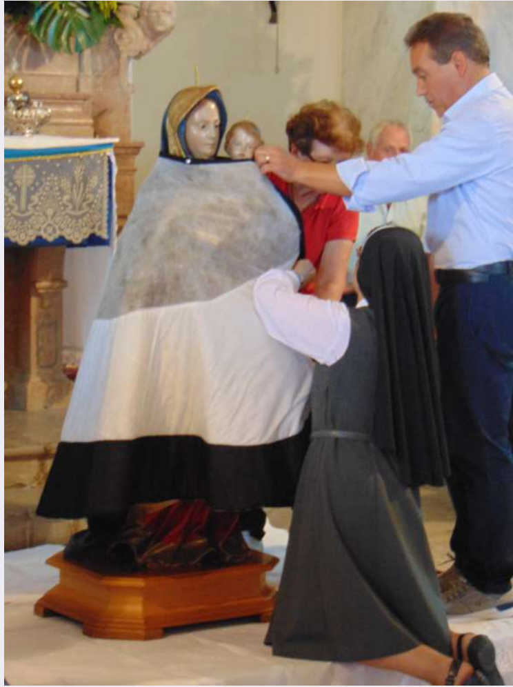
Vestizione statua con gli ex voto.jpg