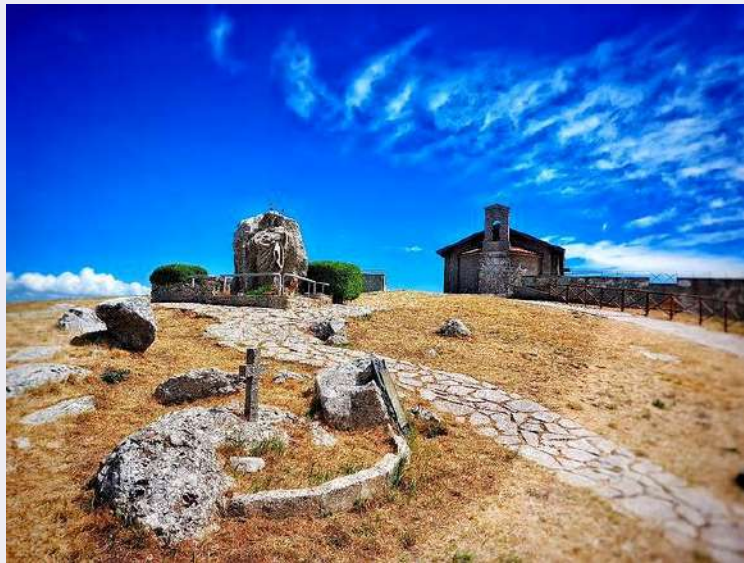
Monumento Madonna del Carmine.jpg