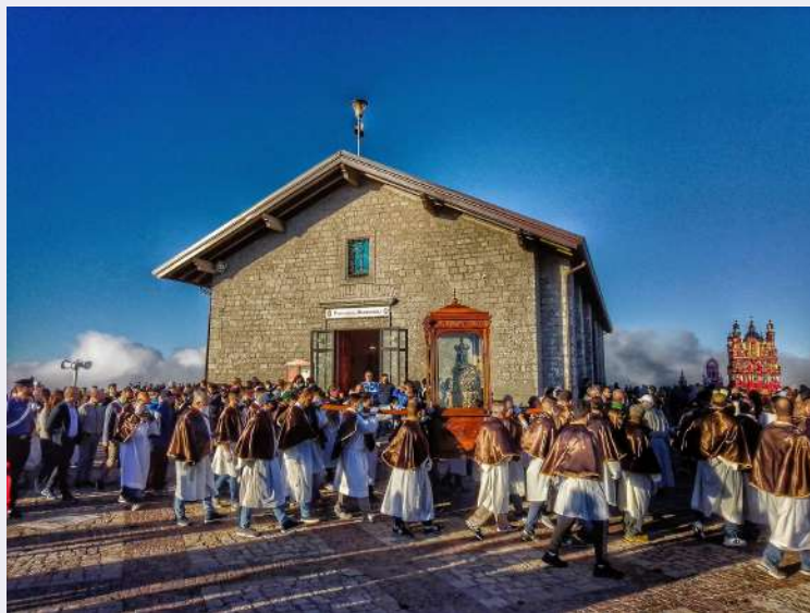
Particolare Processione di ritorno ad Avigliano.jpg