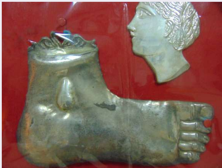
Dipinto votivo ex voto.jpg