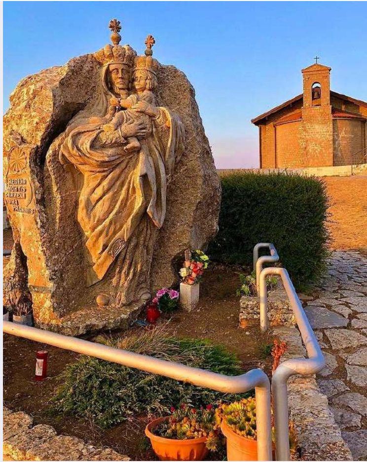
Monumento Madonna del Carmine particolare.jpg