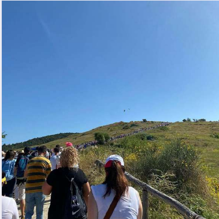
Processione di rientro ad Avigliano.jpg