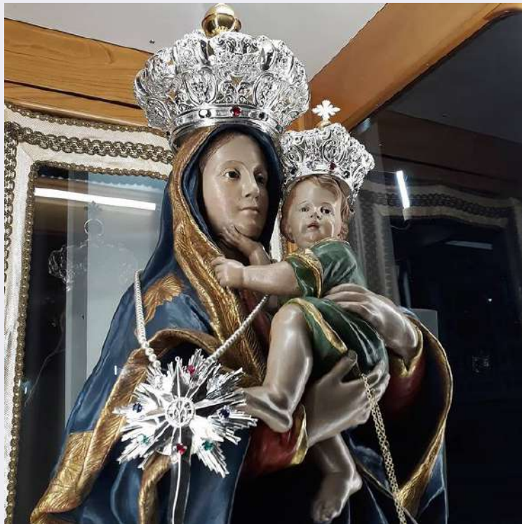
Particolare volto Madonna del Carmine e Bambino.jpg