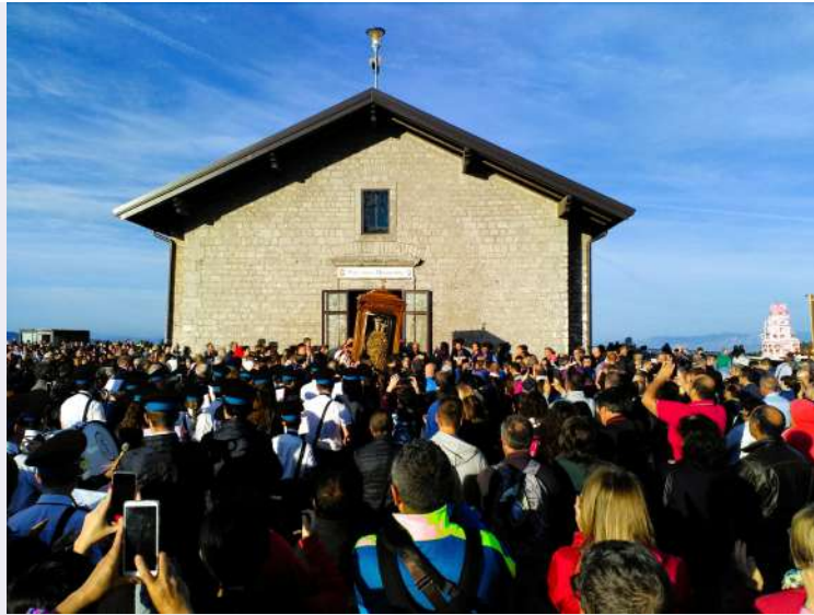
Processione di ritorno ad Avigliano.JPG