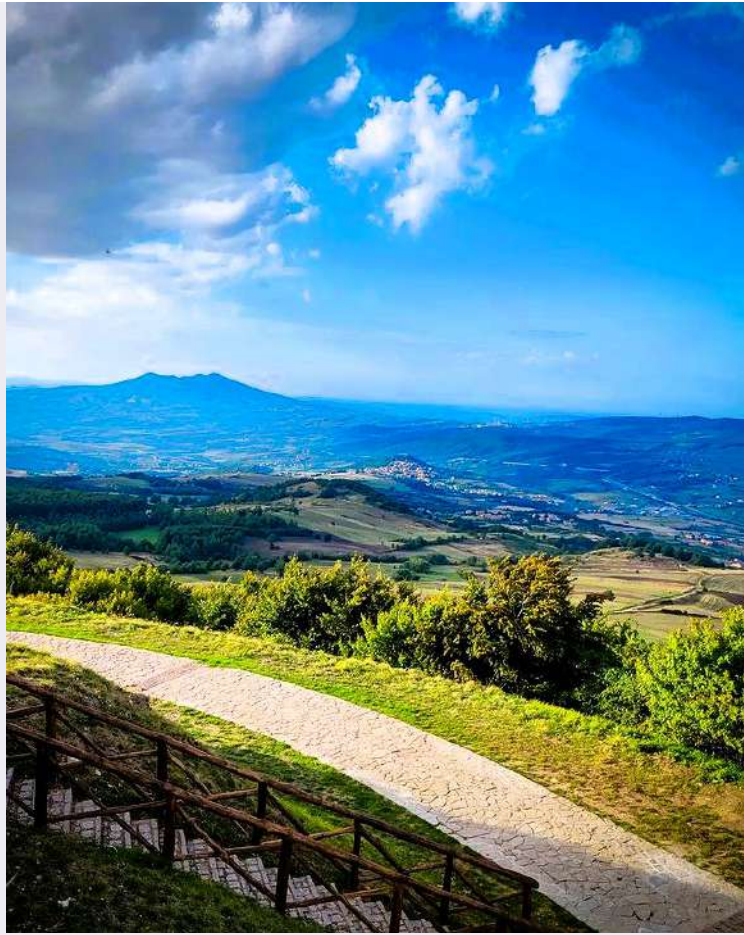
Madonna del Carmine - Monte Carmelo.jpg