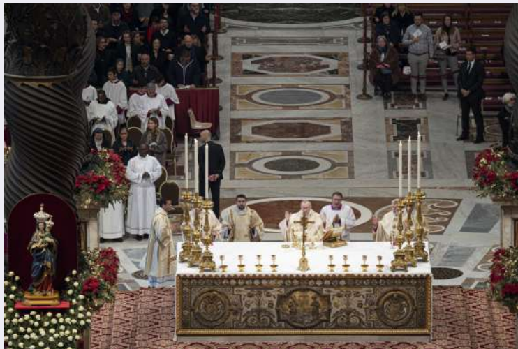
Madonna del Carmine nella basilica di San Pietro.JPG