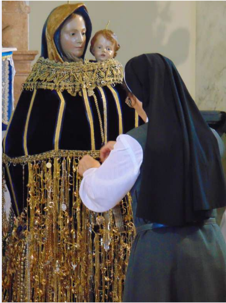
Statua con ex voto.jpg