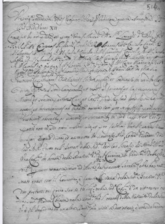
Atto notarile della fondazione della cappella di S. Maria del Carmine (1696)