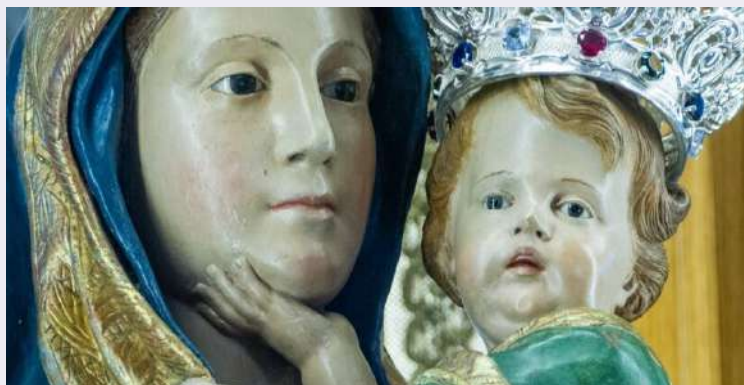
Discesa statua Madonna del Carmine.jpg