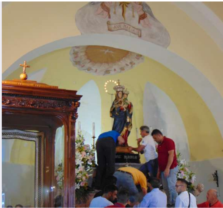
Statua Madonna del Carmine.JPG