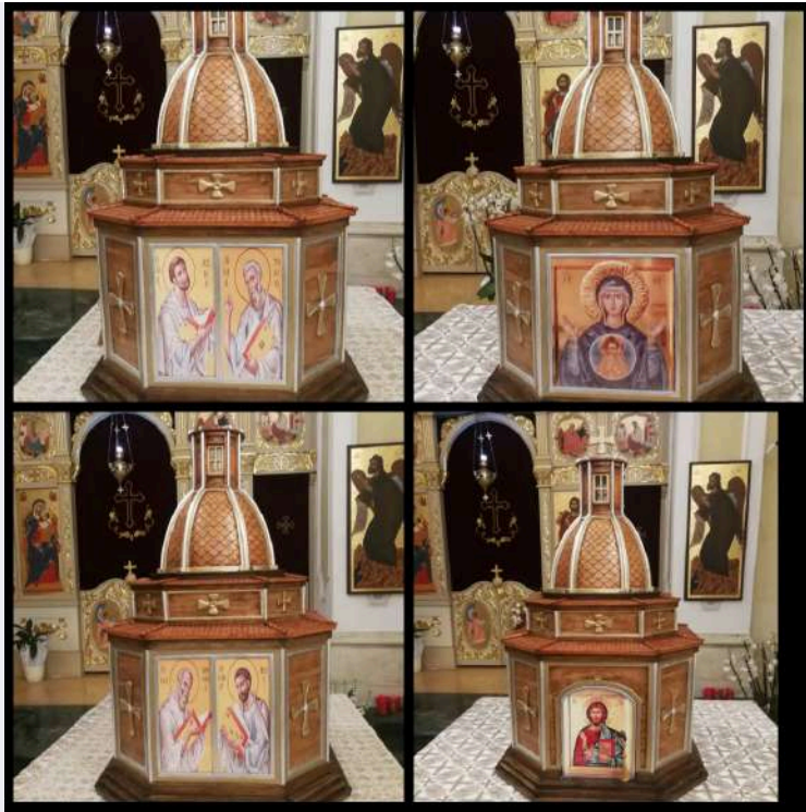
Santa Maria Odigitria.jpg